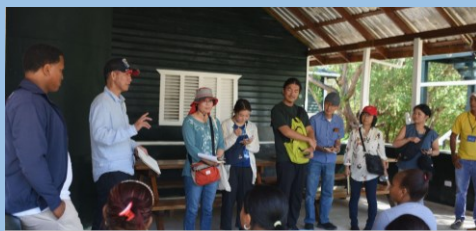
Misión en República Dominicana, visita a lugar de turismo comunitario en Laguna de Oviedo, Pedernales.