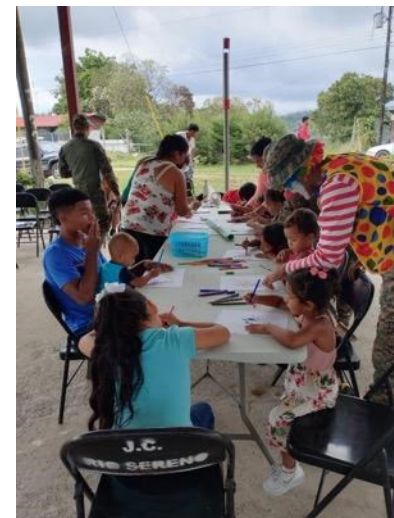
ラ・アミスタ村落間生態系イベントでの自然お絵描き教室