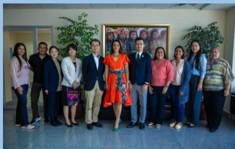
パナマ観光庁、JICA パナマ事務所、パナマ観光会議所、パナマ観光振興会との面談