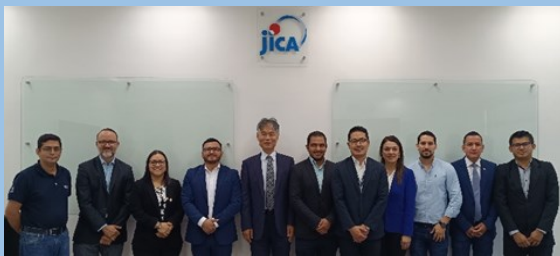
Foto grupal de la presentación de Plan de Acción de El Salvador.