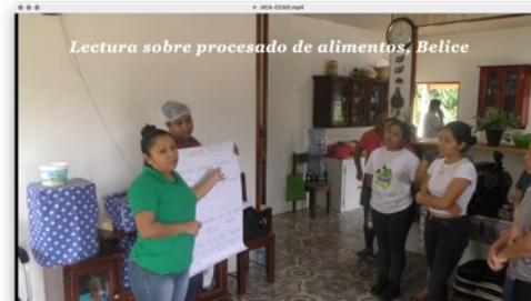
パイロットプロジェクトで撮影した動画をまとめたプロジェクトビデオ