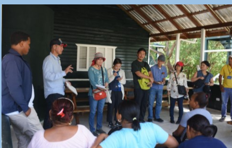
ドミニカ共和国南部のペデルナレス県オビエド湖のコミュニティー観光サイトの視察