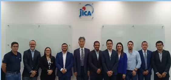
課題別研修アクションプラン発表会集合写真