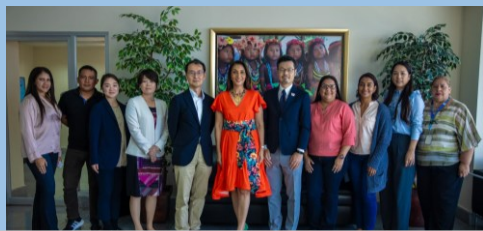
Misión en Panamá, reunión con funcionarios de Autoridad de Turismo de Panamá (ATP), PROMTUR y CAMTUR y JICA Panamá