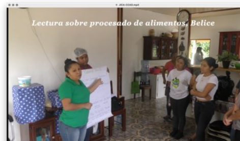
Vídeo del Proyecto recopilados a partir de vídeos grabados durante el proyecto piloto.