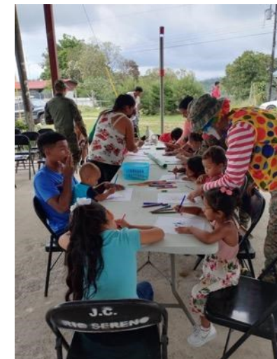
Clase de dibujo de la naturaleza en el evento ecológico inter-pueblos La Amistad (Costa Rica y Panamá).